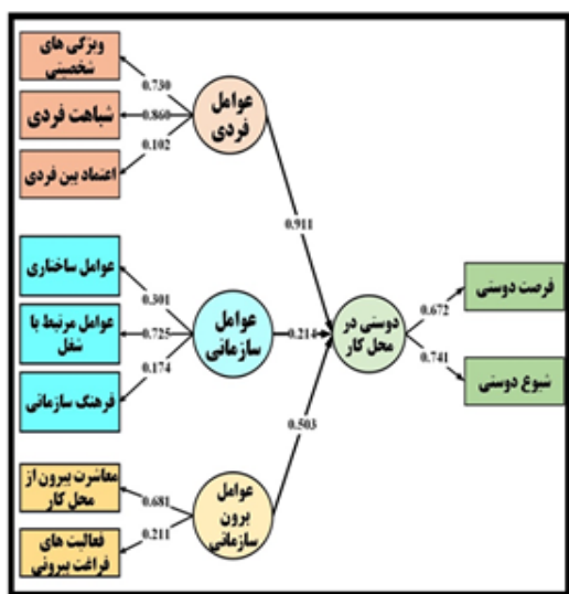
شکل ۲. الگوی ساختاری پژوهش

در شکل شماره (۲) الگوی معادلات ساختاری پژوهش آورده شده است.