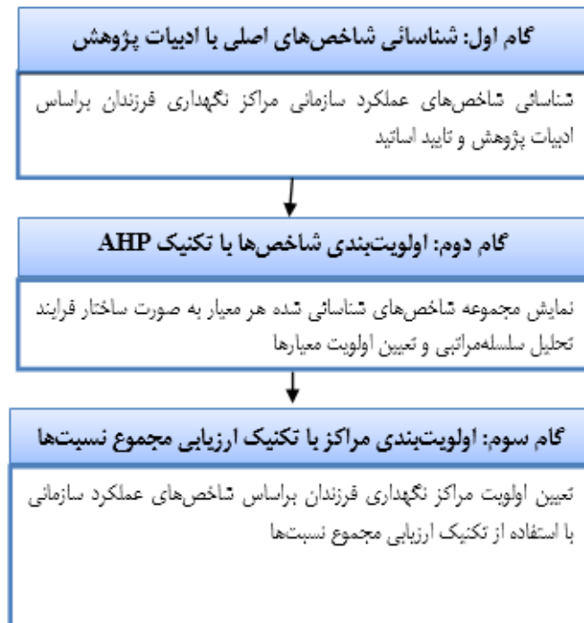
شکل ۱. الگوریتم اجرای پژوهش

بنابراین، دایره انتخاب خبرگان بسیار محدود است و در نتیجه تعداد ۲۰ نفر از افراد واجد شرایط به‌عنوان نمونه مورد بررسی در این مطالعه انتخاب شده‌اند. همان‌طور که عنوان شد، پرسشنامه اصلی مورد استفاده پرسشنامه خبره است. جهت ارزیابی مراکز نگهداری کودکان در روش ARAS از دیدگاه کارشناسان سازمان بهزیستی استفاده شده است. ده نفر از کارشناسان این سازمان بر اساس دو قید تجربه (بالای ده سال سابقه کاری و تحصیلات حداقل مدرک کارشناسی ارشد) از سازمان بهزیستی انتخاب شده‌اند. نمونه‌گیری به روش غیراحتمالی و هدفمند انجام شده است. پرسشنامه خبره جهت اولویت‌بندی معیارهای اصلی تحقیق با استفاده از تکنیک‌های مبتنی بر مقایسه زوجی مورد استفاده یعنی AHP و ARAS است. این پرسشنامه‌ها براساس طیف ۹ درجه ساعتی تنظیم شده است.