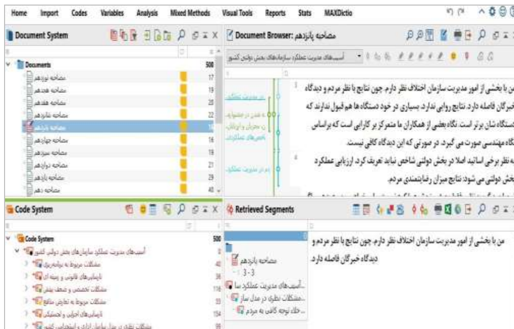
شکل ۲. نمونه متن کدگذاری شده یک مصاحبه در نرم‌افزار مکس کیو دی

آمده است به شکل مفصل ارائه خواهد شد و تنها به تعدادی از عارضه‌های فاز نخست به‌طور فهرستوار بدین شرح اشاره می‌شود: عدم تعهد مدیران، نبودن هدف واضح و مشخص، مشکلات فرهنگی، هم‌راستا نبودن منافع با اجرای مدیریت عملکرد، عدم فهم مشترک میان دست‌اندرکاران، توجه بیش‌ازحد به ستاده و کم‌توجهی به اثر در بلندمدت، نبودن تحلیل، نداشتن اعتدال. شکل ۲ نمونه کدگذاری متن یکی از مصاحبه‌ها (فاز دو) را در محیط نرم‌افزار نشان می‌دهد.