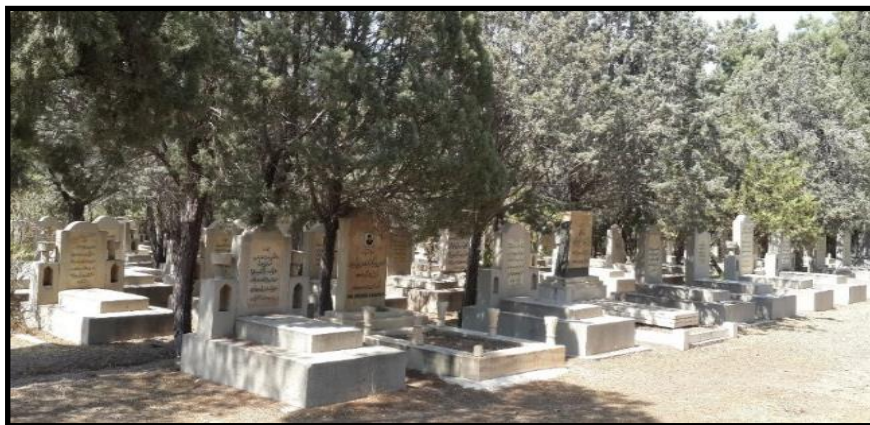
شکل ۵. آرامگاه زرتشتیان امروزی، آرامگاه قصر فیروزه، تهران

آب و هوای گرم و خشک ایران برای رسم دخمه‌گذاری نسبت به آب و هوای هند، مناسب‌تر بود و حصارکشی ستیغ یک کوه دورافتاده نیز، هدف دینی‌شان را برآورده می‌کرد. زرتشتیان محافظه‌کار ایران برای حفظ این رسم و کاستن فشارهای اجتماعی و سیاسی، تمام