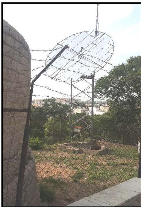
شکل ۲. نمونه‌ای از سولار؛ سیستم استفاده‌شده در دخمه‌های

برخی معتقدند باید ساختمانی مخصوص لاشخورها در اطراف دخمه بسازند و