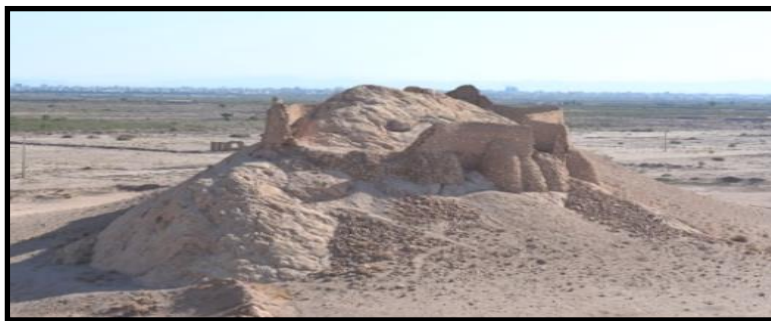
شکل ۳. نمای عمومی دخمه قدیمی کرمان

بررسی ساختار دخمه‌های موجود پارسیان نشان می‌دهد که پارسیان با حفظ ساختاری که هم موضوع خورشیدنگرشی و در معرض پرنده‌گان لاشخور قرار دادن جسد را تأمین کرده و هم از آلوده کردن زمین جلوگیری می‌کند، همراه با پیشرفت موقعیت اجتماعی خود در جامعه هند، به پیچیدگی‌های این ساختار نیز افزوده‌اند.