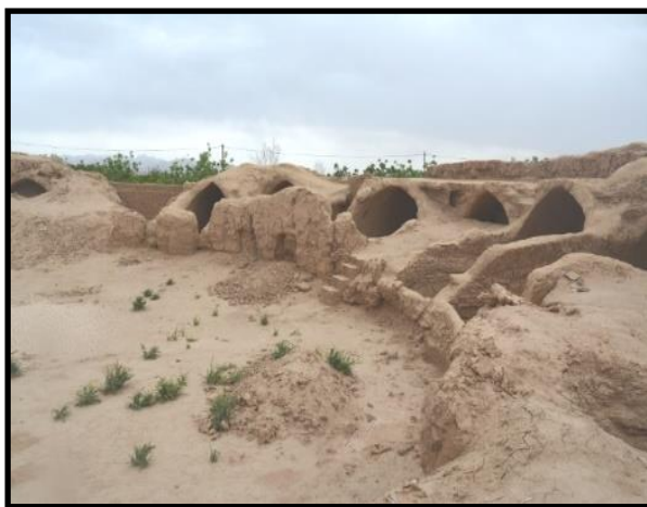
شکل ۴. فضای داخلی دخمه

هوف، استودان شهر ری را، که خواجه نظام‌الملک در کتاب خود به آن اشاره کرده است، ترکیبی (استودان و دخمه) می‌داند که هم برای در معرض قراردادن جسد و هم به عنوان محل جمع‌آوری استخوان‌های پاک‌شده کاربرد داشته است. وی معتقد است پیش از اسلام نیازی به دخمه‌های ترکیبی نبوده و احتمالاً این نوع دخمه‌ها مربوط به بعد از اسلام است. در قرون اولیه اسلامی، این برج‌ها در ایران پدید آمد و طرح آن را پارسیان هند از زرتشتیان ایران گرفتند (Huff, 2004: 619). یک نمونه دخمه دوجداره در روستای شریف‌آباد یزد وجود دارد که حصار مدور پیرامون دخمه، آن را از سایر دخمه‌ها متمایز کرده است (مهرآفرین و حیدری، ۱۳۹۴: ۱۴۷). این دخمه نمونه‌ای از تغییرات ناشی از اوضاع و احوال اجتماعی است، چراکه، بنا به نوشته بویس، به دلیل جلوگیری از تعرض مسلمانان بعد از ساخت دخمه، دیوار مدور پیرامون دخمه ساخته شده است (Boyce, 1979: 193). شاید منظور خواجه نظام‌الملک از دخمه دوپوشش چنین دخمه‌ای بوده است.