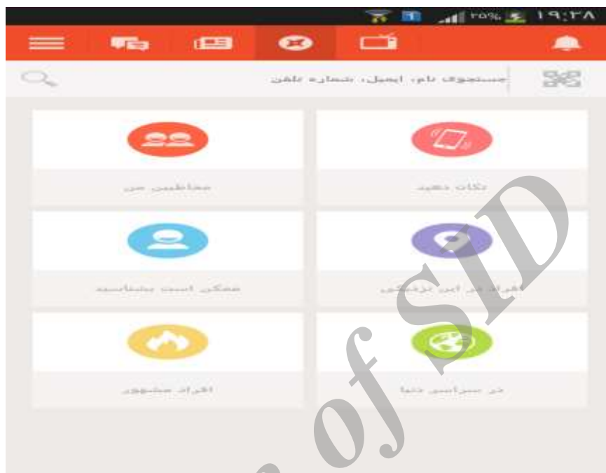
شکل شماره ۲: صفحه اصلی شبکه اجتماعی تانگو