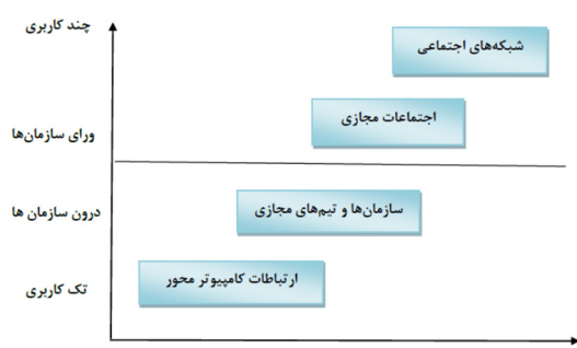
شکل ۱. سطوح مجاز در فضای مجازی (پانتیل ۲۰۰۹)

پانتیل (۲۰۰۹) در زمینه شبکه‌های مجازی اجتماعی، چهار سطح از مجاز در دنیای دیجیتال را مورد بررسی قرار می‌دهد و معتقد است که شبکه‌های اجتماعی مجازی در بالاترین سطح از مجاز قرار دارند. (شکل ۱)