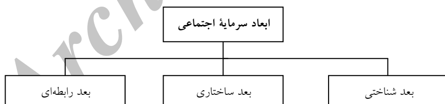
شکل ۱. ابعاد سرمایه اجتماعی (Nahapit & Ghoshal, 1998, p.242)

تحقیقات بی‌شماری در حوزه سرمایه اجتماعی انجام گرفته است، اما هنوز مؤلفه‌ها و ابعاد اصلی سرمایه اجتماعی ناشناخته باقی مانده است. چالش اساسی این مطالعات، نبود اجماع بین اندیشمندان درباره شاخص‌ها و رویکردهای ارزیابی جنبه‌ها و ابعاد سرمایه اجتماعی است (Harper, 2002). به نظر پاتنام، سرمایه اجتماعی ویژگی‌های بسیار مختلفی دارد که شناسایی ابعاد آن در اولویت است (Putnam, 2000, p.107). محققان از زوایای مختلفی مؤلفه‌ها و ابعاد سرمایه اجتماعی را طبقه‌بندی کرده‌اند و مدل‌های گوناگونی را در این زمینه طراحی کرده‌اند. یکی از معروف‌ترین آن‌ها، مدل ناهایت و گوشال (۱۹۹۸) است که دربرگیرنده سه بعد است: بعد ساختاری، بعد شناختی و بعد رابطه‌ای (طبرسا و همکاران، ۱۳۹۴، ص ۱۸۶).