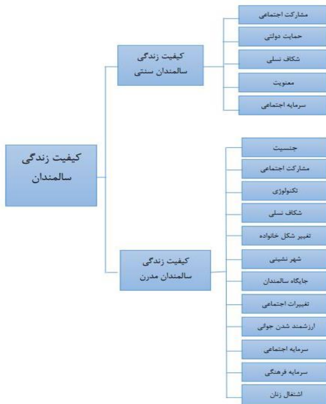
نمودار ۳. مدل مفهومی کیفیت زندگی سالمندان سنتی و مدرن (محقق ساخته)

بر اساس نتایج به دست آمده از مدل‌های رگرسیونی، مدل اولیه (مدل ۱) را که به طور کلی در خصوص کیفیت زندگی سالمندان مطرح شد می‌توانیم به تفکیک برای کیفیت زندگی سالمندان سنتی و مدرن مدل‌بندی کنیم.