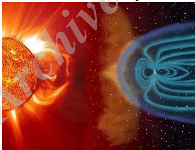
تصویر شماره ۳: لایه‌های حفاظتی در مقابل اشعه‌های مضر

۳. بادهای خورشیدی: موج مواد سنگینی که در فضا وجود دارد توسط لایهٔ مغناطیسی جو زمین (مگنتوسفر) دفع می‌شوند.