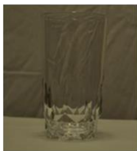
لیوان خالی (احساس یا دیدن ..... بسیار آسان بود)