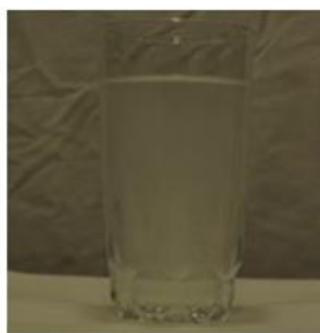
لیوان روشن (احساس یا دیدن ..... نه سخت بود نه آسان)