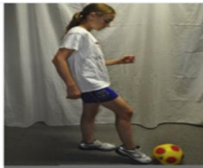
تصویرسازی دیداری بیرونی (دید سوم شخص)