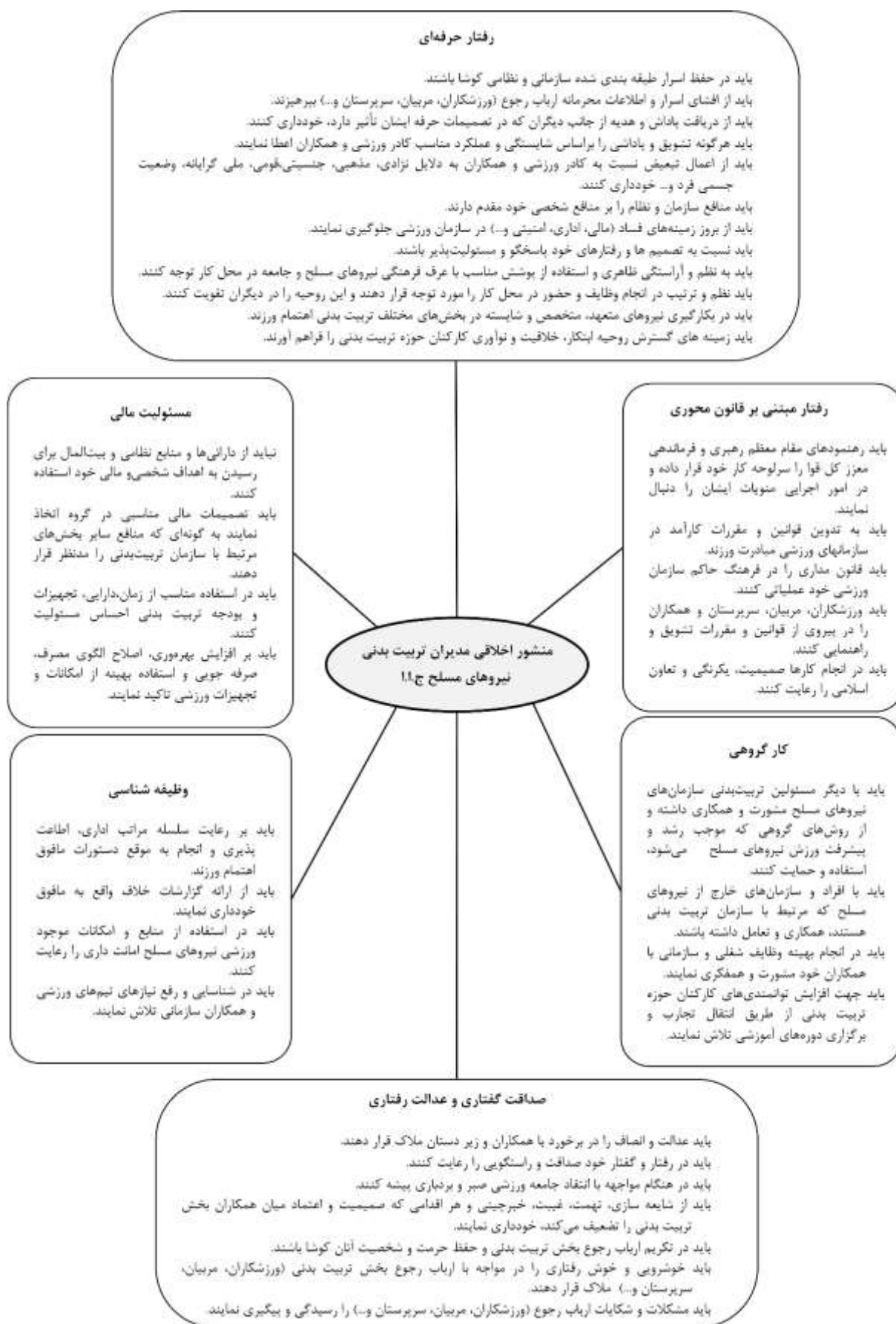
شکل ۳- منشور اخلاقی مدیران تربیت بدنی نیروهای مسلح ج.ا.ا