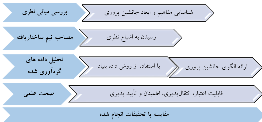
شکل ۱. مراحل انجام پژوهش

شناسایی شده بین مقوله‌ها و زیر مقوله‌ها در کدگذاری باز و محوری، مقوله‌ها به هم مرتبط شدند و نظام نظری مربوطه ارائه شد. به‌طور کلی و به ترتیب مراحل انجام پژوهش شامل موارد شکل (۱) بوده است: