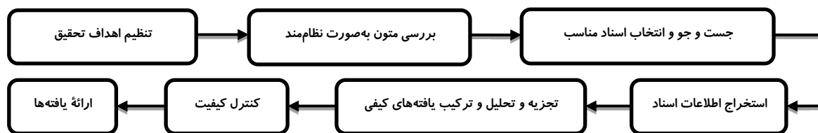
شکل ۱. مراحل فراترکیب

هدف مورد نظر تحقیق که مطالعه فرآیند مدیریت استعدادیابی فوتبال آلمان و ارائه مدلی از این برنامه بود، از روش ۷ مرحله‌ای ساندلوسکی و همکاران (۲۰۰۷) استفاده شد که در شکل ۱، خلاصه این مراحل نمایش داده شده است: