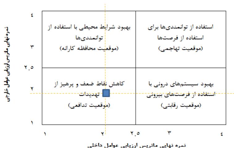
شکل ۴. ماتریس داخلی - خارجی (IE) حکمروایی شایسته و محدوده راهبردی دارای اولویت

با توجه به ماتریس IE (شکل ۴) مشاهده می‌شود که شهر بیرجند از نظر حکمروایی شایسته شهری در وضعیت مناسبی قرار ندارد، به طوری که ماتریس، موقعیت تدافعی را نشان می‌دهد.