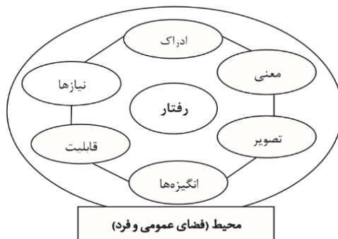
شکل ۱. عوامل تشکیل‌دهنده فرد در محیط