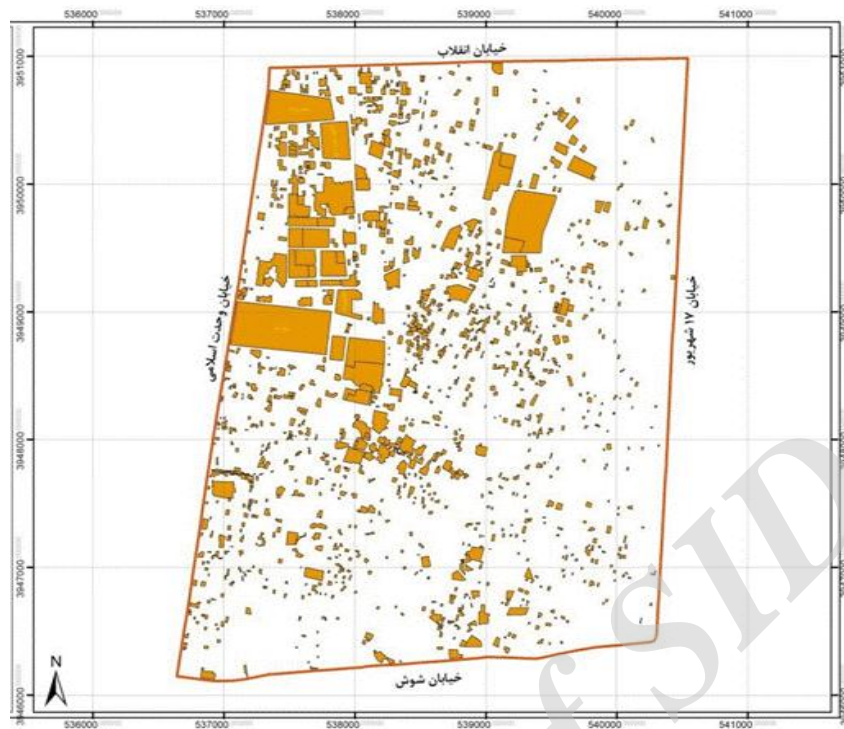
شکل ۲. نقشه توزیع فضایی جاذبه‌های گردشگری در منطقه ۱۲

در حال حاضر، مدیریت بافت تاریخی منطقه ۱۲، حدود هزار اثر را که از نظر معماری و تاریخی در قالب ارزشیابی خاصی درجه‌بندی شده‌اند، با هدف تهیه شناسنامه شناسایی کرده که بنا بر اولویت برای ۳۷ بنا شناسنامه کامل تهیه شده است. اثر ثبت سازمان میراث فرهنگی است که ۱۴۸ مورد آن‌ها ارزش‌گذاری شده است. در مجموع، ۱۸ موزه، ۵۷ خانه قدیمی، ۱۰ مدرسه قدیمی، ۲۲ مسجد و مدرسه، ۲۲ بازار و بازارچه، ۲۴ امام‌زاده و بقعه، ۱۲ کلیسا و کنیسه و معبد، ۱۰ مدرسه علمیه، ۱۸ حمام، ۴ آب‌انبار، ۴ باغ، ۱۰ گورستان، ۱۵ سقاخانه، ۴ حسینیه، ۳ بانک، ۳ بیمارستان، ۳ سالن تئاتر، ۳۳ ساختمان ویژه، ۲۵ سرا، ۶ سفارت، ۶ عمارت، ۳ کاروانسرا، ۳ سهدر، ۵ میدان و ۴۵ مورد متفرقه، گنجینه تاریخی منطقه ۱۲ را شکل می‌دهند. بازار تهران از مهم‌ترین مکان‌های تاریخی این منطقه است.