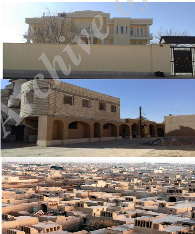
شکل ۲. نمونه یک مسکن با تلفیق فناوری امروزی و ساخت و معماری سنتی بومی

این شاخص در ۵ مؤلفه ارزیابی می‌شود. جدول ۱۰ نشان می‌دهد بالاترین مقدار میانگین رتبه به محله ۲۲۲ و سپس محله ۱۱۳ مربوط است. محله ۲۲۲ از محله‌های جدید شهر میبد است که بافت مسکونی جدید، دسترسی مناسب و خدمات نسبتاً مناسبی دارد. محله ۱۱۳ نیز از محله‌های مهم و پرجمعیت شهر میبد محسوب می‌شود که خدمات مناسبی در آن وجود دارد. کمترین مقدار میانگین رتبه نیز به محله ۱۱۱ و سپس محله ۲۱۱ مربوط است. محله ۱۱۱ محله‌ای حاشیه‌ای است و خدمات مناسبی ندارد. محله ۲۱۱ هم محله‌ای قدیمی است و بافتی قدیمی و فرسوده دارد. همچنین دسترسی در این بافت پایین است و خدمات برای جمعیت چندان مناسب نیست.