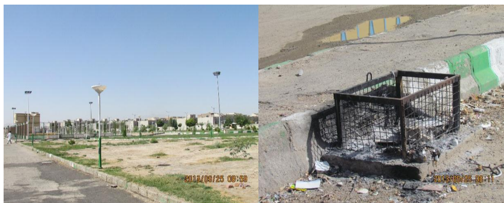
شکل ۱. نمایش از وضعیت مبلمان شهری در سطح شهر زاهدان