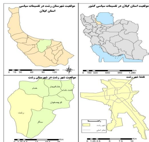
شکل ۲. محدوده مورد مطالعه در تقسیمات سیاسی کشور

شهر رشت، مرکز استان گیلان در محدوده ۴۹ درجه و ۳۵ دقیقه و ۴۵ ثانیه طول شرقی و ۳۷ درجه و ۱۶ دقیقه و ۳۰ ثانیه عرض شمالی قرار دارد و مساحت آن حدود ۱۰۲۴۰ هکتار است (باباپور ورجاری، ۱۳۸۹: ۳۶) (شکل ۲). این شهر آب‌وهوایی مرطوب و معتدل دارد و یکی از مرطوب‌ترین شهرهای ایران، به‌ویژه در فصل پاییز شناخته می‌شود (مهندسان مشاور طرح و کاوش، جلد هشتم، ۱۳۸۶: ۱۹). جمعیت شهر رشت براساس آخرین سرشماری در سال ۱۳۹۵ برابر با ۶۷۹۹۹۵ نفر بوده است که در مقایسه با سال ۱۳۹۰ رشدی معادل ۱/۳ درصد داشته و نسبت به سال‌های پیشین سیر نزولی داشته است. خانوارهای ساکن در شهر رشت ۲۲۸۱۴۲ هستند و بعد آن ۲/۹۸ است (مرکز آمار ایران، سرشماری عمومی نفوس و مسکن، ۱۳۹۵).