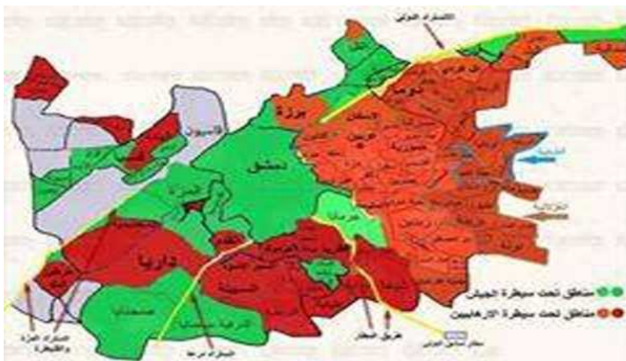
نقشه مناطق تحت تصرف گروه‌های معارض سوری در سال ۲۰۱۳