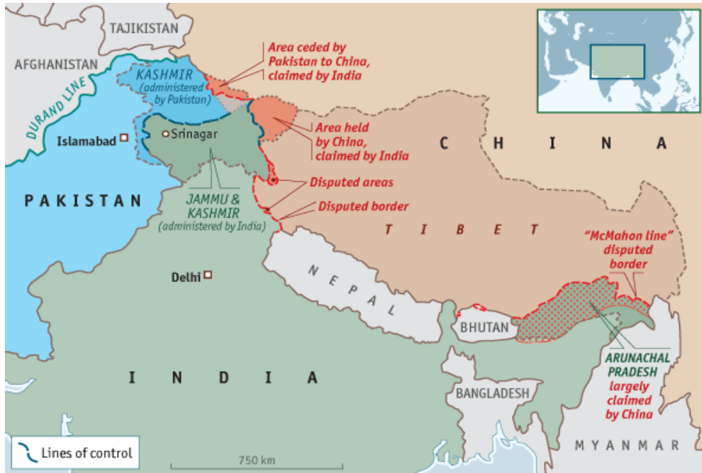
نقشه ۲: مرزهای خطچین و مناطق پرتنش بین چین، هند و پاکستان