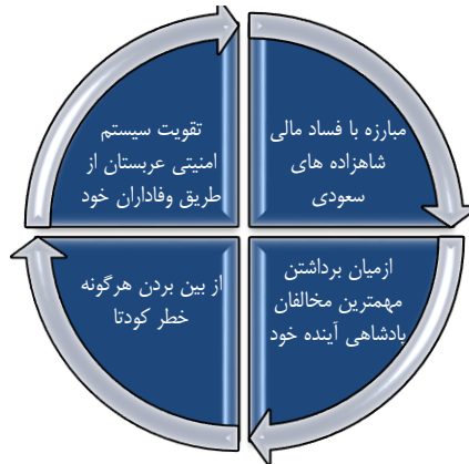
شکل ۱. چهار علت عمده دستگیری شاهزاده‌های سعودی از سوی بن سلمان