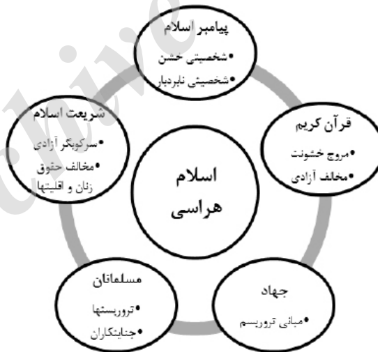
نمودار شماره ۱- دال مرکزی و دالهای شناور اسلام‌هراسی اتاقهای فکر غربی

در عین حال، همان‌گونه که در نظریه «لاکلاو» و «موفه» تأکید شده، عاملان سیاسی در جبر ساختار محبوس نیستند، بلکه از آزادی عمل کافی برای شکل دادن به ساختار و کنش‌های لازم برخوردارند. اتاق‌های فکر امریکا و انگلیس و کارشناسان آنها، شکل‌دهنده و صورت‌بخش جریان اسلام‌هراسی هستند و نقش پیشرو و عاملیت را در این حوزه ایفا می‌کنند. از سویی، گروه‌های افراطی و تندرو نیز با اقدامات تروریستی -چه در جهان غرب و چه علیه جهان اسلام- به تشدید راهبرد اسلام‌هراسی کمک کرده‌اند و تصویری خشن، نابردبار، جزمی و مخالف هرگونه آزادی از اسلام در افکار عمومی غرب نشان داده‌اند.