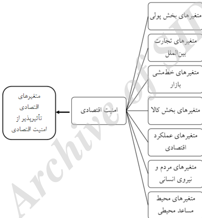
شکل ۲: الگوی کلی سنجش امنیت اقتصادی

بر اساس نتایج به‌دست‌آمده از تحلیل محتوای اسناد و کدگذاری و مقوله‌بندی، در نهایت الگوی مفهومی تأثیر متغیرهای فوق را می‌توان به‌صورت ذیل نشان داد: