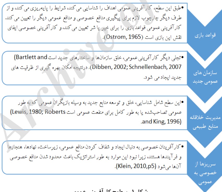
شکل ۱- سطوح کارآفرینی عمومی

اندیشمندان در خصوص کارآفرینی عمومی، تعاریف مختلفی را ارائه داده‌اند اما در مجموع می‌توان آن را به این صورت جمع‌بندی کرد: «فرآیند خلق ارزش برای شهروندان از طریق گرد هم آوردن ترکیباتی از منابع دولتی یا خصوصی برای بهره‌برداری از فرصت‌های اجتماعی تمرکز این کارآفرینی عمومی بر خدمات‌رسانی کارآمدتر به شهروندان است (الوانی و همکاران، ۱۳۸۹، ص ۸)». علاوه بر این تعریف ارائه شده، می‌توان کارآفرینی عمومی ۱ را در چهار سطح دسته‌بندی کرد که در قالب شکل زیر به آن پرداخته شده است.