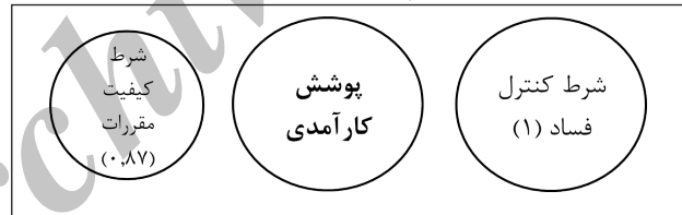
نمودار ۲- پوشش شروط

شکل زیر نیز نشان‌دهنده میزان پوشش و اهمیت این دو شرط است.