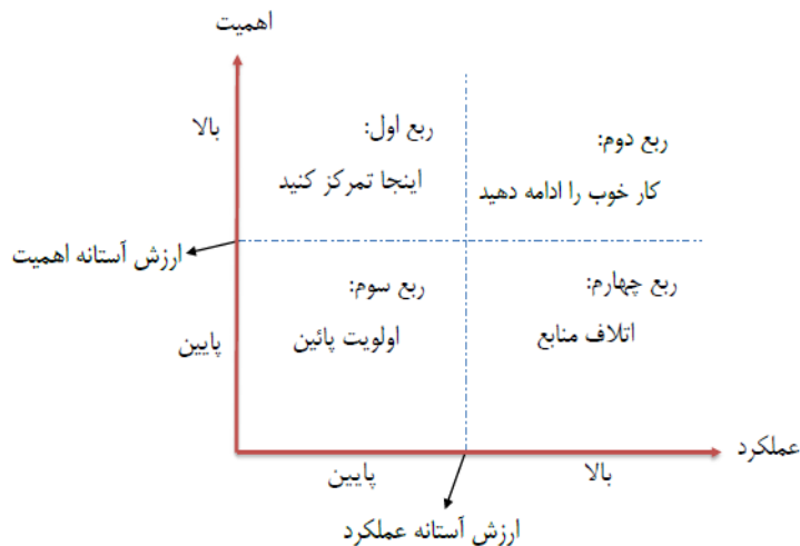
شکل ۱ - مدل ربعی تحلیل اهمیت-عملکرد (آذر و همکاران، ۱۳۹۵)

موضوع با استفاده از روش نخبگانی و پرسشنامه می‌تواند در شناخت و آسیب‌شناسی وضعیت موجود و ارائه راهبرد و راهکار مؤثر باشد. نقش این ماتریس که دارای چهار قسمت (یا چارک) است و در هر چارک، راهبرد خاصی قرار دارد، کمک به فرآیند تصمیم‌گیری است. در این مدل، از میانگین داده‌های مربوط به سطح عملکرد و میانگین داده‌های مربوط به درجه اهمیت هر یک از عوامل، برای تعیین مختصات هر شاخص و نمایش آن در ماتریس IP، استفاده می‌شود. به این ترتیب، با جفت شدن این دو مجموعه از مقادیر، هر یک از عوامل در یکی از چهار ربع ماتریس IP قرار می‌گیرند (Hisham & Ainin, 2008 p.100). ناحیه اول (ناحیه توجه حیاتی): پاسخ‌دهندگان، عوامل را از نظر اهمیت بسیار بالا ارزیابی می‌کنند، ولی سطح عملکرد این عوامل به نسبت پایین است. بنابراین باید تلاش‌های بهبود و توسعه را در این ناحیه متمرکز کرد.