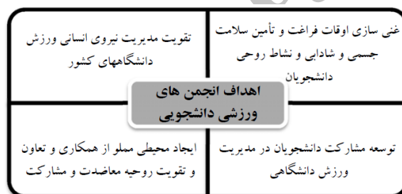
شکل ۱. اهداف انجمن‌های ورزش (منبع: آیین‌نامه تشکیل انجمن‌های ورزشی دانشجویی، ۱۳۷۹) (۱)

بلکه این انجمن‌ها می‌توانند سود مالی نیز داشته باشند، اما این سود را نمی‌توان بین اعضا تقسیم کرد (۲۴). بی‌تردید توفیق در دستیابی به اهداف عالی و پیشرفت کشور، مرهون جهد و جهاد و تکاپوی فکری و علمی و تلاش و سازندگی نسل جوان، به‌ویژه دانشجویان است. انجمن‌های ورزشی دانشجویی از جمله اولین نهادهای دانشجویی بودند که با اهداف مذکور آغاز به فعالیت کردند. از این‌رو وزارت علوم، تحقیقات و فناوری با درک زمان‌شناسانه در تحولات جهانی در عرصه منابع نیروی انسانی داوطلب و به‌منظور فعالیت‌های مختلف دانشجویی و افزایش انگیزه آنان و ایجاد شور و نشاط اجتماعی و کمک به توسعه وفاق و سازگاری جمعی و به‌ویژه توجه به اصل تغییر نیازها در جوانان و با تأکید بر اصل تکریم، توسعه و توانمندسازی دانشجویان در عرصه‌های مختلف از