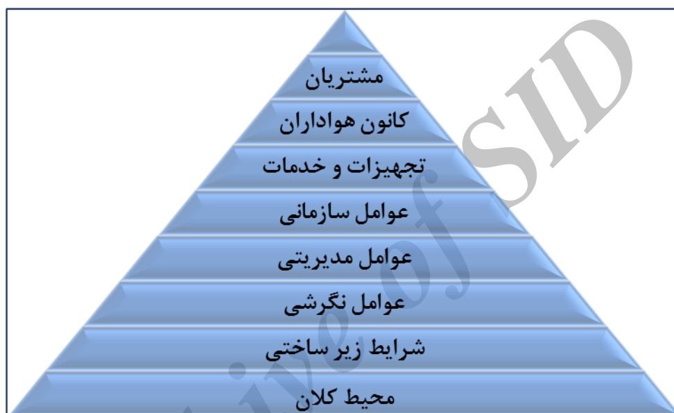
شکل ۲. الگوی نظری عوامل محیطی مؤثر بر مدیریت ارتباط با مشتری در باشگاه‌های حرفه‌ای فوتبال ایران

در صنعت ورزش آشنایی داشتند و هم روش کیفی را می‌شناختند. از این خبرگان خواسته شد تا نظرهای خود در مورد فرایند تدوین و مدل نهایی را ارائه دهند؛ بیشتر آنها مدل را تأیید کردند و بعضی از آنها نظرهای اصلاحی داشتند که در فرایندی رفت‌وبرگشت، اصلاحات اعمال و نظر نهایی آنها دریافت شد.