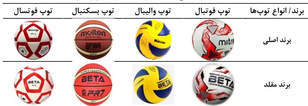
جدول ۱. نمونه‌هایی از تقلید برند بتا از برندهای پیشرو

همچنین در مرحله اول دلفی ۵۴ عبارت که از مطالعه ادبیات موجود استخراج شده بود، در قالب پرسشنامه‌ای که ۱۰ مؤلفه را به‌عنوان راهکارهای موفقیت استراتژی تقلید در شرکت‌های کارآفرین ورزشی ارائه می‌کرد، به‌منظور شناسایی به‌خبرگان ارائه شد. پس از جمع‌آوری پرسشنامه‌ها و اعمال نظر خبرگان، تیم بازبینی عبارت‌هایی که در سیستم پنج‌ارزشی لیکرت نمره ۴ و بیشتر را کسب کرده بودند، در تحقیق باقی‌نگه داشتند و مابقی را حذف کردند.