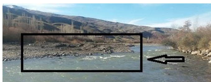
شکل (۵) برداشت شن و ماسه به صورت محلی در بازه ۴ Fig (5) Local sand removal

در بازه‌ی چهارم رودخانه نسبتاً محدود بوده و به صورت ناپیوسته دشت سیلابی در یک طرف وجود دارد و طرف دیگر به دامنه‌ی کوه متصل شده است. الگوی رودخانه سینوسی بوده، رسوبات بستر از ماسه ریز و درشت تشکیل شده است. اما این بازه از نظر تغییرات انسانی شدیداً تحت تأثیر می‌باشد. از جمله برداشت شن و ماسه (شکل ۵)، وجود سازه پل بر روی رودخانه، وجود منطقه‌ی مسکونی و تخریب پوشش گیاهی کناره‌ی رودخانه را می‌توان ذکر کرد. برای فرسایش کناره‌ی نیز با استفاده از مدل NBS نتایج نشان داد که فرسایش کناره‌ی در این بازه شدید است که در مشاهدات میدانی نیز این مورد مشهود بود. که وجود دخالت‌های انسانی بالا در این مقطع موجب شده که مقدار MQI به دست آمده برای این مقطع ۰/۴۸۷ باشد و در طبقه ضعیف قرار بگیرد.