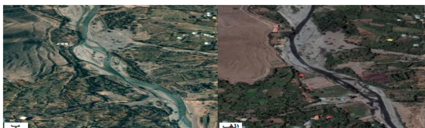
شکل (۶) (الف) تصویر ماهواره‌ای در سال ۲۰۱۷ (ب) تصویر ماهواره‌ای در سال ۲۰۰۷ از بازه‌ی ۵ Fig (6) a) Google earth image in 2017 b) Google earth image in 2007 in six th reach

هر دو طرف به دشت سیلابی متصل می‌شود. بر اساس تصاویر ماهواره‌ای در طول ۱۰ سال از سال ۲۰۰۷ تا ۲۰۱۷ مسیر کانال تغییر یافته است (شکل ۶). شیب بستر به طور میانگین حدود ۰/۰۱۷ متر بر متر و طول بازه و رسوبات بستر نیز از ماسه و گراول تشکیل شده است. عرض کانال از ۲۵ تا ۳۵ متر متغیر است فرسایش کناره‌ای در این بازه براساس مدل NBS خیلی زیاد است. از نظر تغییرات انسانی در این بازه برداشت شن و ماسه به صورت محلی وجود دارد و سازه‌های کنار این بازه شامل جاده و پل می‌شود و در مجموع میزان MQI برای این بازه ۰/۵۸۵ می‌باشد که در طبقه متوسط قرار می‌گیرد.