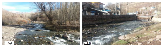
شکل (۲) الف) دیوار چینی و ساخت پل ب) بستر گراولی و دست‌نخورده در بازه ۱ Fig (2) a) A rip rap and bridge construction b) undisturbed and gravel bed in the first reach

این بازه در ناحیه‌ی کوهستانی و بالادست رودخانه قرار گرفته که از هر دو طرف به دره وصل شده و محدود است. براساس مدل NBS دارای فرسایش کناره‌ای خیلی کم بوده و متوسط شیب بستر در این بازه ۰/۰۲۸ است. این بازه دارای بستر گراولی می‌باشد (شکل ۲). عرض کانال از ۱۰ تا ۱۸ متر متغیر بوده و دارای الگوی تک‌کانالی است. حدود ۲۰٪ از این بازه تحت تأثیر دخالت‌های انسانی بوده که شامل پل، دیوارچینی کانال رود می‌باشد (شکل ۲). اما با توجه به اینکه ۸۰٪ بقیه‌ی بازه دست‌نخورده بوده و حالت طبیعی دارد، میزان MQI به دست آمده در این بازه ۰/۷۱۴ بود که در طبقه خوب قرار می‌گیرد.