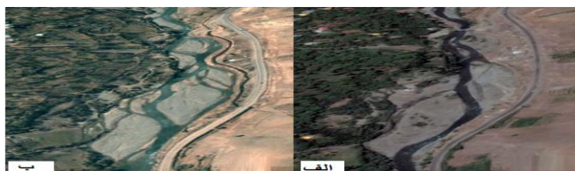
شکل (۴) الف تصویر ماهواره‌ای سال ۲۰۱۷ ب) تصویر ماهواره‌ای سال ۲۰۰۷ در بازه‌ی ۳ Fig (4) a) Google earth image in 2017 b) Google earth image in 2007 in third reach

در بازه‌ی چهارم رودخانه نسبتاً محدود بوده و به صورت ناپیوسته دشت سیلابی در یک طرف وجود دارد و طرف دیگر به دامنه‌ی کوه متصل شده است. الگوی رودخانه سینوسی بوده، رسوبات بستر از ماسه ریز و درشت تشکیل شده است. اما این بازه از نظر تغییرات انسانی شدیداً تحت تأثیر می‌باشد. از جمله برداشت شن و ماسه (شکل ۵)، وجود سازه پل بر روی رودخانه، وجود منطقه‌ی مسکونی و تخریب پوشش گیاهی کناره‌ی رودخانه را می‌توان ذکر کرد. برای فرسایش کناره‌ی نیز با استفاده از مدل NBS نتایج نشان داد که فرسایش کناره‌ی در این بازه شدید است که در مشاهدات میدانی نیز این مورد مشهود بود. که وجود دخالت‌های انسانی بالا در این مقطع موجب شده که مقدار MQI به دست آمده برای این مقطع ۰/۴۸۷ باشد و در طبقه ضعیف قرار بگیرد.