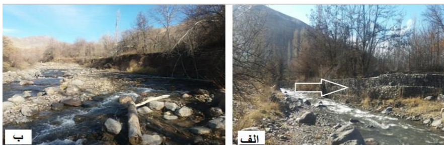
شکل (۳) الف) سنگچینی دیواره و گابیون‌بندی ب) واریزه‌های چوبی، رسوبات گراولی و قطعه سنگی

میزان فرسایش کناره در این بازه بر اساس مدل NBS کم می‌باشد، همچنین شیب بستر کانال به صورت میانگین در این بازه ۰/۰۲۴ است. این بازه دارای الگوی نک کانالی با سینوسیته کم است و واحدهای ژئومورفولوژی آن شامل اشکال درون کانالی و اشکال طولی در حاشیه کانال اشد (شکل ۳). در مجموع میزان MQI در این بازه ۰/۵۸۴ بوده که در طبقه متوسط قرار می‌گیرد.