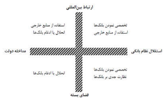
شکل ۱. تمایل متقاضیان منابع مالی به بانک