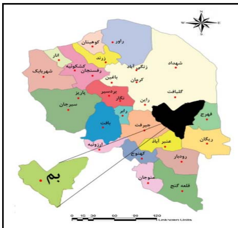
شکل شماره ۳- موقعیت جغرافیایی منطقه مورد مطالعه

روستایی پیرامون آن به ۱۴۲۳۷۶ نفر می‌رسید. این شهر در سحرگاه روز جمعه ۵ دی‌ماه ۱۳۸۲ برابر با ۲۶ دسامبر ۲۰۰۳ ساعت ۵ و ۲۶ دقیقه و ۵۷ ثانیه زلزله‌ای ویرانگر به عمق کانونی ۷ کیلومتر از سطح زمین و بزرگی 6/3 ریشتر را تجربه نمود که باعث تلفات و خسارات مالی و جانی جبران‌ناپذیری گردید (گزارش دبیرخانه ستاد راهبردی و سیاست‌گذاری بم: ۱۳۸۳: ۱۱). بروز این حادثه منجر به کشته شدن بیش از ۳۰۰۰۰ نفر و زخمی شدن بیش از ۲۵۰۰۰ نفر گردید. قریب به ۸۰ درصد بافت کالبدی شهر بم تخریب‌شده و در مجموع ۳۹۳۶۱ واحد مسکونی و تجاری شهری در بم و ۳۲۴۰۰ واحد روستایی در ۲۵۰ روستا آسیب‌دیده و ۷۰۰۰۰ نفر بی‌خانمان شدند (Omidvar et al, 2010: 303). در همین حادثه ارگ بم با ۲۵۰۰ سال قدمت به‌عنوان بزرگ‌ترین سازه خشتی جهان، به کلی ویران شد و این در حالی است که از لحاظ عظمت و زیبایی با دیوار چین مقایسه می‌شود. به دلیل ثبت بم و فضای فرهنگی آن در میراث جهانی یونسکو مأموریت بازسازی ارگ بم که نماد مقاومت مردم بم لقب دارد، به ۱۲ کشور خارجی از جمله ایتالیا، آلمان، فرانسه، ژاپن و دیگر کشورهای عضو میراث جهانی یونسکو سپرده شد. امروزه یکی از مقاصد اصلی هر مسافری که به استان کرمان سفر می‌کند بازدید از ارگ بم قدیم- جدید و آثار باقیمانده از زلزله سال ۱۳۸۲ است. حس کنجکاوی و هیجان انسان دوستانه گردشگران، انگیزه اصلی برای سفر به این شهر است. توجه به ظرفیت مناسب منطقه بم به لحاظ گردشگری سیاه، ایجاد زیرساخت‌ها و امکانات مناسب و درعین‌حال برنامه‌ریزی و مدیریت صحیح می‌تواند، به شکوفایی و توسعه منطقه، خروج آن از محرومیت و کم‌رنگ نمودن آثار منفی زلزله مذکور کمک زیادی کند.