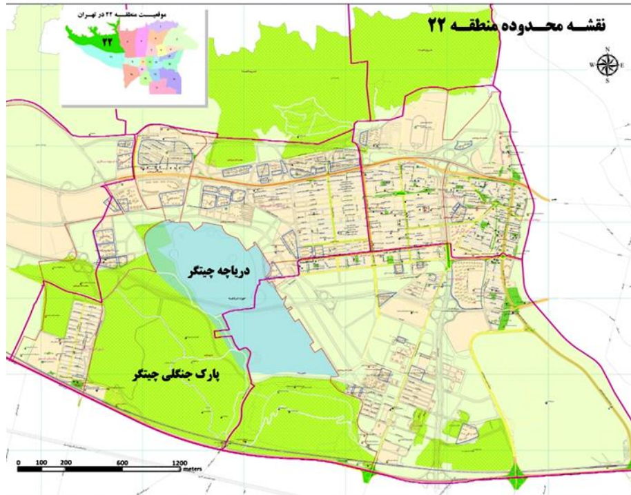
شکل شماره ۲. موقعیت پارک چیتگر در غرب تهران

پایین ترین نقطه ارتفاعی پارک، ۱۲۲۵ متر از سطح آب های آزاد ارتفاع دارد و بلندترین نقطه ارتفاعی آن نیز ۱۳۱۳ متر و متوسط ارتفاع نیز حدود ۱۲۶۹ متر می باشد (شرکت جهاد تحقیقات آب و آبخیزداری، ۱۳۸۱: ۱).