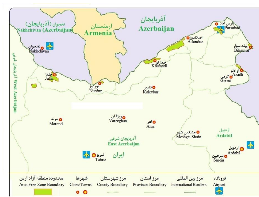
شکل شماره ۱. موقعیت جغرافیایی محدوده مورد مطالعه

منطقه آزاد ارس با مرکزیت جلفا در فاصله ۱۳۷ کیلومتری تبریز و ۷۶۱ کیلومتری تهران در شمال غرب کشور در نقطه صفر مرزی در مجاورت با کشورهای ارمنستان، آذربایجان و جمهوری خودمختار نخجوان و حاشیه رودخانه زیبای ارس به طول ۱۲۸ کیلومتر با چشم‌اندازی زیبا و دیدنی استقرار یافته است.