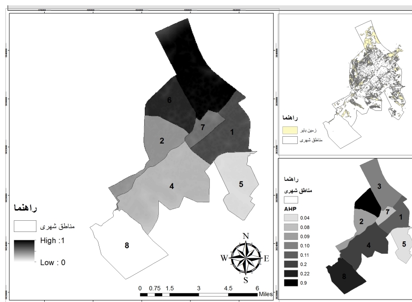
شکل ۴- تحلیل فضایی مناطق شهری قم به منظور احداث پروژه مسکن اجتماعی با تاکید بر روش AHP

با توجه به خروجی جدول (۸) مقادیر وزن محاسبه شده برای مناطق هشت‌گانه شهر قم به منظور اجرای پروژه‌های مسکن اجتماعی در محیط ArcGIS به منظور ارائه تحلیلی مناسب و دید فضایی بهتر نسبت به مناطق شهر قم وارد شده و نتایج حاصل از آن در قالب شکل (۴) ارائه گردیده است.