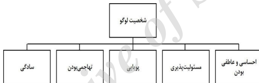
شکل ۱- ابعاد شخصیت لوگو

یادشده که توسط پاینه (۲۰۱۳) صورت گرفت، نتایج حاکی از آن بود که طرح لوگو بر شخصیت لوگو موثر بوده است (به‌طور مثال، طرح‌های طبیعی لوگو، دارای شخصیتی پویا و احساسی هستند و طرح‌های هم‌آهنگ، از سادگی خاصی برخوردارند) و شخصیت درک‌شده از طرح لوگو، بر قصد خرید مصرف‌کننده تأثیر می‌گذارد. به‌طور قطع، شخصیت قایل‌شده برای یک لوگو، بر اساس استنباطی است که افراد از طرح لوگو برداشت می‌کنند؛ بخصوص در این پژوهش که لوگوهای به‌کار گرفته‌شده ناآشنا بوده و هیچ پیش‌زمینه‌ی ذهنی در مخاطب ایجاد نمی‌کردند. شخصیت لوگو طبق پژوهش‌های قبلی (پاینه ۱ ، ۲۰۱۳؛ گوئز، ۲۰۰۹) دارای پنج بُعد به شرح زیر است، که در شکل ۱ ترسیم گردیده است: