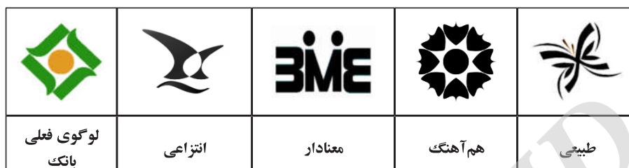
جدول ۲- طرح‌های به کار گرفته شده در این پژوهش

نظریه شبه‌انسان‌گرایی بیان می‌کند که مردم تمایلی طبیعی دارند تا برندها را واقعیتی انسان‌گونه ببخشند. در واقع خصیصه‌های انسانی را به اشیای غیرانسانی تسری دهند (گوثریه ۲ ، ۱۹۹۷). بر اساس همین منطق، می‌توان چرخه زندگی برندها را با چرخه زندگی انسان‌ها مقایسه نمود. هر برندی تاریخ تولدی دارد (ارایه برند به بازار)، دوران کودکی‌ای دارد (سال‌های اولیه)، دوران بلوغ خود را سپری می‌کند (و مشکلات بالقوه سر باز می‌کنند)، ازدواج می‌کند (از طریق ادغام یا تملیک) و مسن‌تر می‌شود (سهم بازارش کاهش پیدا می‌کند و فروشش کم و کم‌تر می‌شود) و سرانجام می‌میرد (این امر به دلیل مدیریت نامناسب و کم‌اثر رخ می‌دهد) (لهوو، ۲۰۰۴؛ آکر، ۱۹۹۷). جوان‌سازی، مزیت تطبیق‌پذیری لوگوها را در بر دارد؛ برخلاف نام برند، شرکت‌ها این امکان را دارند تا لوگوهای خود را در هر زمانی به‌روز کنند.