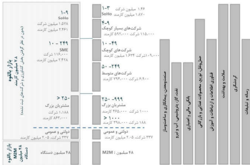
شکل ۲: بخش‌بندی بازار شرکتی فناوری اطلاعات و ارتباطات ایران (یافته‌های پژوهش، ۱۳۹۵)

با توجه به مصاحبه‌ها و مطالعات صورت گرفته، از میان شیوه‌های متعدد بخش‌بندی بازار شرکتی در حوزه فناوری اطلاعات و ارتباطات، عمدتاً معیارهای زیر مورد استفاده قرار می‌گیرند: ۱. نوع مصرف‌کننده نهایی مشتری شرکتی یا سازمانی ۲. اندازه یا سایز مشتری شرکتی یا سازمانی ۳. نوع صنعت یا زمینه فعالیت مشتری شرکتی یا سازمانی. این معیارها باعث خواهد شد تا بخش‌بندی بازار شرکتی این حوزه، قابلیت اندازه‌گیری، دسترسی، سودآوری و پاسخ‌دهی که از معیارهای بخش‌بندی موفق است، داشته باشد. شایان ذکر است موارد فوق به عنوان معیارهای اصلی هستند، به عبارت دیگر در ادامه بخش‌بندی و جزیی‌تر کردن آن، معیارهای دیگر نیز ممکن است به فراخور مورد استفاده قرار گیرند. ۱ بر این اساس، بازار شرکتی در این حوزه، شامل سه دسته‌بندی عمده از مشتریان است. این سه گروه عبارتند از: ۱. شرکت‌ها و سازمان‌های خصوصی که برای استفاده خود، کارکنان یا مشتریان‌شان، محصولات یا سرویس‌ها را خریداری می‌کنند. ۲. سازمان‌ها و نهادهای دولتی