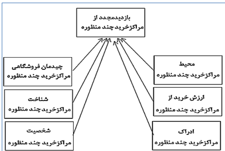
شکل ۱. الگوی پژوهش کیفی

در مطالعه دوم، میانگین ادراک از مرکز خرید در گروه ادراک پایین از مرکز خرید به مقدار ۲/۵۱۳ و میانگین ادراک از مرکز خرید در گروه ادراک بالا از مرکز خرید به مقدار ۳/۵۶۰ است. آماره آزمون برای مقایسه میانگین متغیر کنترل و دست‌کاری ادراک از مرکز خرید با مقدار ۱۱/۹۹۲ و سطح معنی‌داری کوچک‌تر از ۰/۰۱ حاکی از وجود تفاوت در میانگین متغیر کنترل و دست‌کاری ادراک از مرکز خرید است. با توجه به اینکه که میانگین در گروه ادراک بالا از مرکز خرید به صورت معنادار بالاتر از میانگین ادراک پایین از مرکز خرید است در نتیجه می‌توان ادعا کرد که نمونه آماری نقش خود در سناریو را درک کرده است. میانگین ارزش خرید سودمندگرایی در گروه مشتریان دارای ارزش خرید سودمندگرایی از مرکز خرید به مقدار ۳/۵۴۴ و میانگین ارزش خرید سودمندگرایی در گروه مشتریان دارای ارزش خرید لذت‌جویانه از مرکز خرید به مقدار ۲/۴۹۶ است. آماره آزمون برای مقایسه میانگین متغیر کنترل و دست‌کاری ارزش