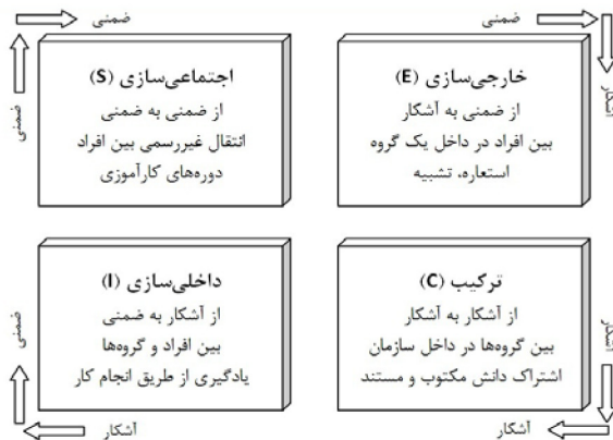
شکل ۱ - یادگیری و انتقال دانش با استفاده از چرخهٔ SECI (جاجدو، ۲۰۰۷)

سازوکارها و فرآیندهای یادگیری بین‌سازمانی نیز در دستور کار این تحقیق قرار گرفت. مدل SI، با اضافه‌شدن یک مرحله به مدل 4I که به‌عنوان یک مدل یادگیری درون‌سازمانی ارائه شده بود طراحی شده‌است. براساس این مدل، یادگیری بین‌سازمانی در ادامهٔ مراحل چهارگانهٔ نهادینه‌شدن دانش در داخل یک سازمان (4I) و همزمان با انتقال آن به سازمانی دیگر اتفاق می‌افتد (جونز و مکفرسون، ۲۰۰۶). به‌عبارت‌دیگر پس از اینکه یادگیری فردی از طریق شهود حاصل می‌شود، دانش فرد در گروه‌های کاری به بحث و اجرا گذاشته شده و در صورت موافقت گروه و سازمان، با دیگر رویه‌ها و روتین‌های سازمان پیوند می‌خورد. بکارگیری این دانش در بخش‌های مختلف باعث می‌شود به تدریج این دانش در سازمان نهادینه شود. در زمان همکاری با دیگر سازمان‌ها، به جز مواردی که سازمان‌ها با هم و به‌صورت مشترک یاد می‌گیرند (هولمکویست، ۲۰۰۳)، بخش‌هایی ارزشمند از دانش و تجربیات قبلی هر کدام از آن‌ها نیز با شرکت دیگر به اشتراک گذاشته شده و با اشاعهٔ آن به شرکت همکار، یادگیری بین‌سازمانی حاصل می‌شود. این یادگیری می‌تواند در هر دو جهت (از شرکت الف به شرکت ب و یا بالعکس) صورت پذیرد.