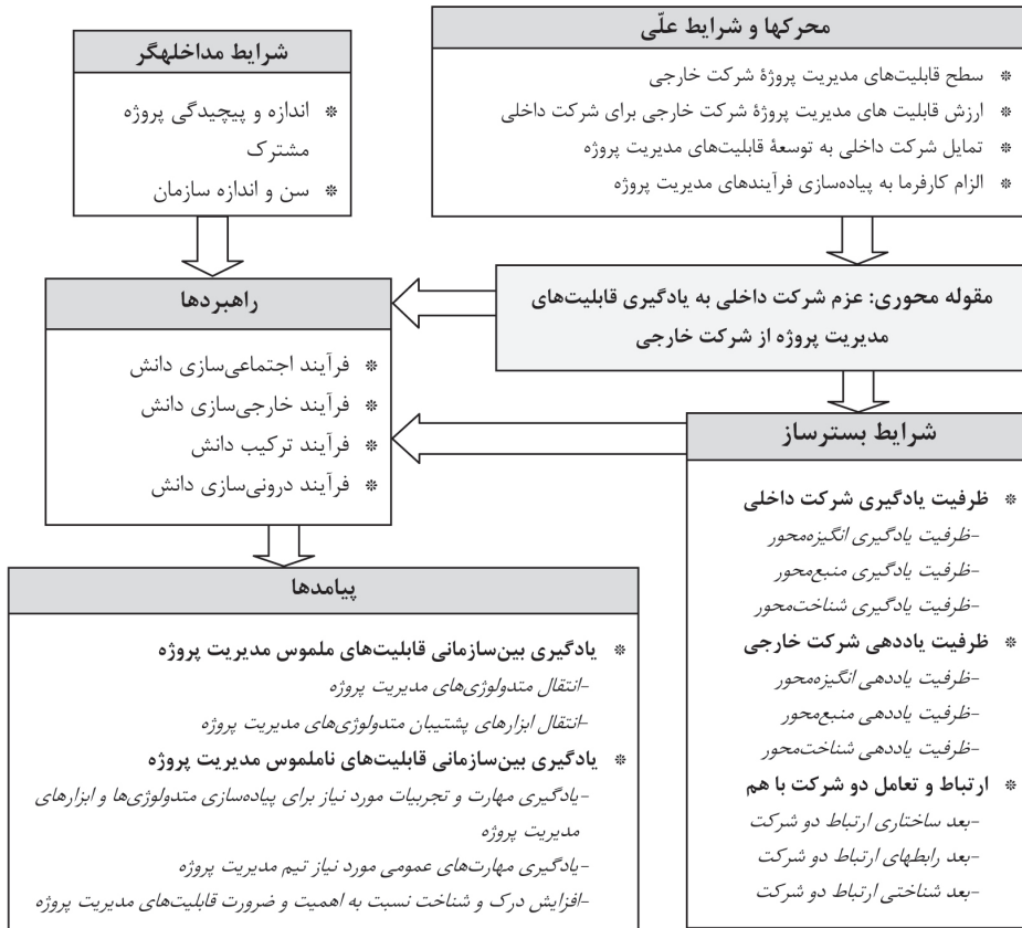
شکل ۳ - مدل مفهومی یادگیری بین‌سازمانی قابلیت‌های مدیریت پروژه، (نگارنده)