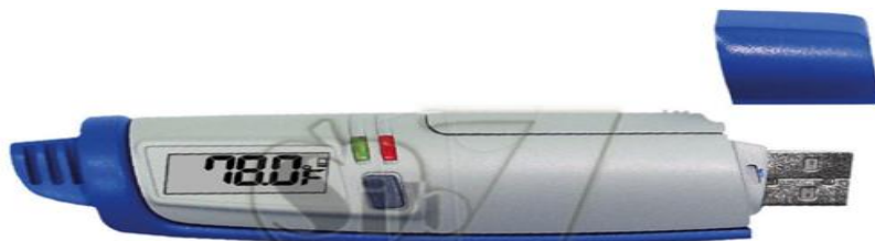
شکل ۱ دیتالاگر مورد استفاده برای ثبت داده‌های دما در بابلسر

برای بررسی تفاوت رفتار دما در بابلسر از چهار ایستگاه ثبت داده استفاده شد. علاوه بر استفاده از داده‌های ایستگاه هواشناسی بابلسر که در داخل شهر قرار گرفته، سه دستگاه مجهز به ثبت‌کننده خودکار یا دیتالاگر از نوع MIC 98583 USB-Data Logger, Taiwan با قابلیت ثبت داده‌های دما ( شکل ۱) در فواصل زمانی متفاوت در دو محیط شهری (سازمان مرکزی دانشگاه مازندران و اداره کشاورزی بابلسر) و یک فضای برون شهری (پردیس دانشگاه مازندران) نصب شد (شکل ۲).