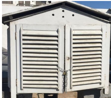
شکل ۳ جعبه نگهداری دیتالاگر ثبت داده

برای رعایت شرایط یکسان دستگاههای اندازه گیری، جعبه چوبی مشبکی که جریان هوا بتواند از آن عبور کند، مطابق استاندارد سازمان هواشناسی تهیه و استفاده شد. جعبه پایش در ارتفاع حدود ۱/۵ متری از سطح زمین قرار داده شد (شکل ۳).