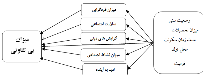
مدل شماره ۱: مدل تجربی پژوهش (برگرفته از فرایند پژوهش)