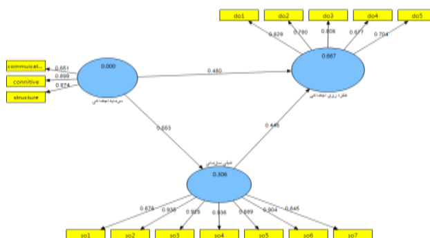
شکل شماره (۲): ضرایب تعیین و ضرایب مسیر مدل پژوهش

نتیجه حاصل از محاسبه میزان شاخص نیکویی برازش مدل پژوهش حاضر نشان می‌دهد، این مقدار برابر ۰/۴۰ بوده است که نشان‌دهنده برازش خوب مدل مفهومی این پژوهش است.