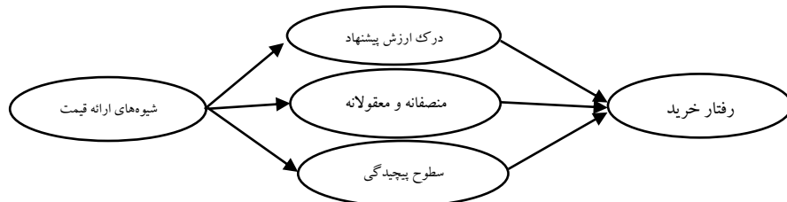
نمودار (۱). مدل مفهومی تاثیر شیوه‌های ارائه قیمت محصول بر رفتار خرید

با توجه به نقش عوامل روانشناختی "درک ارزش پیشنهادی"، "منصفانه بودن قیمت‌گذاری" و "پیچیدگی قیمت‌گذاری" به عنوان متغیرهای میانجی بین روش‌های ارائه‌ی قیمت محصول و رفتار خرید، فرضیات زیر در تحقیق حاضر تدوین گردیده است: