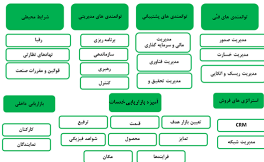
نمودار (۳). مدل برندسازی شرکت‌های بیمه بازرگانی