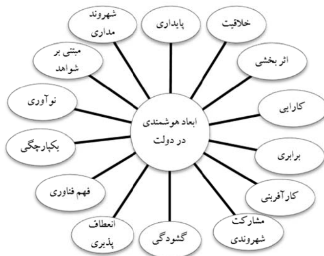
شکل ۱. ابعاد هوشمندی در دولت

۱۴۲ فصلنامه مطالعات مدیریت کسب و کار هوشمند، سال ششم، شماره ۲۱، پاییز ۱۳۹۶