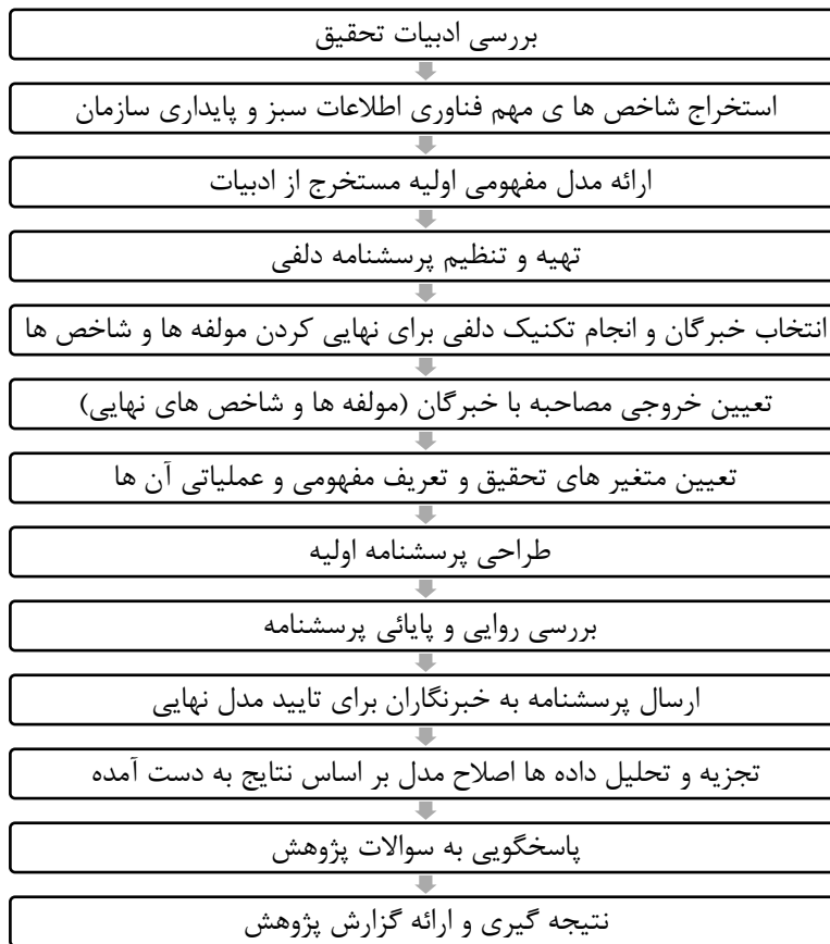
شکل ۳: مراحل عملی پژوهش

موضوع تحقیق حاضر توجه به مفاهیمی را مدنظر قرار داده که چارچوب اولیه آن از جمله مدل های اولیه تحقیق توسط محقق تبیین گردیده است، لیکن برای رسیدن به چارچوب نهایی آن مواردی نظیر تبیین فرضیه و یا عدم نیاز به ارائه آن و احیاناً پرداختن به مفاهیم و متغیرهای جدید و مؤثر در مدل های مذکور، بهره گیری از نظرات خبرگان به روش دلفی را برای اعتبار بخشیدن به این بخش از کار تحقیق ضروری می نماید. این بخش از مطالعه ماهیت توصیفی و کیفی دارد که در دو مرحله انجام شده است الف: در مرحله اول به شکل اسنادی و کتابخانه ای به گردآوری ابعاد و شاخص های موجود فناوری اطلاعات سبز و پایداری