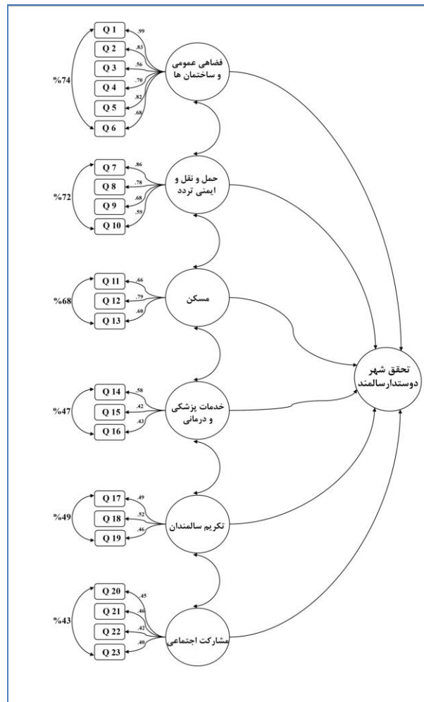
شکل شماره ۳. میزان ضرایب معناداری در تمام مؤلفه‌ها

با توجه به شکل ۳ میزان ضرایب معناداری در تمام مؤلفه‌ها مشاهده می‌شود. در شکل ۳ دو متغیر کالبدی و اجتماعی وجود دارد که هر کدام آن‌ها با زیر شاخص‌هایی مورد بررسی قرار گرفته است. در میان ابعاد کالبدی از شاخص‌های فضاهای عمومی و ساختمان‌ها، حمل‌ونقل، مسکن و خدمات پزشکی و بهداشتی استفاده شده است. مقدار بارهای عاملی به‌طور میانگین بالای ۰/۴۸ است. فضاهای عمومی و ساختمان‌ها با ۰/۹۰ (وجود پارک‌ها و فضای سبز با امکانات ورزشی) است لازم به ذکر است که در بین ابعاد کالبدی بالاترین میانگین (۰/۷۴) متعلق به فضاهای عمومی و ساختمان‌ها است. رتبه دوم به حمل‌ونقل ایمنی تردد با میانگین (۰/۷۲) اختصاص دارد در بین ابعاد اجتماعی مؤلفه‌های تکریم سالمندان با میانگین (۰/۴۹) و شاخص‌های فرهنگی و رفاهی با میانگین (۰/۵۴) بالاترین رتبه‌ها را به خود اختصاص داده است.