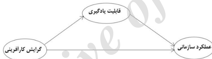
شکل ۱: مدل مفهومی تحقیق

رابطه بین گرایش کارآفرینی و عملکرد صادراتی به‌وفور در ادبیات تحقیق بررسی شده است. پژوهش حاضر قصد دارد تا علاوه بر بررسی تأثیر مستقیم گرایش کارآفرینی بر عملکرد صادراتی، اثر غیرمستقیم آن را از طریق قابلیت یادگیری به‌عنوان یکی از ابعاد مهم قابلیت‌های پویا بر عملکرد صادراتی در شرکت‌های کوچک و متوسط بسنجد. با توجه به ادبیات پژوهش و همچنین فرضیات مطرح شده، مدل مفهومی پژوهش در شکل ۱ نشان داده شده است. در این مدل متغیر عملکرد صادراتی به‌عنوان متغیر وابسته، قابلیت یادگیری به‌عنوان متغیر میانجی و گرایش کارآفرینی به‌عنوان متغیر مستقل مطرح شده است.