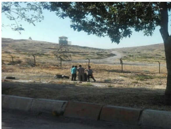
منبع: نگارندگان مهر ماه ۱۳۹۷

تصویر ۴: ضلع غربی شهرک صادقیه، فضای بازی و اجتماع کودکان شهرک